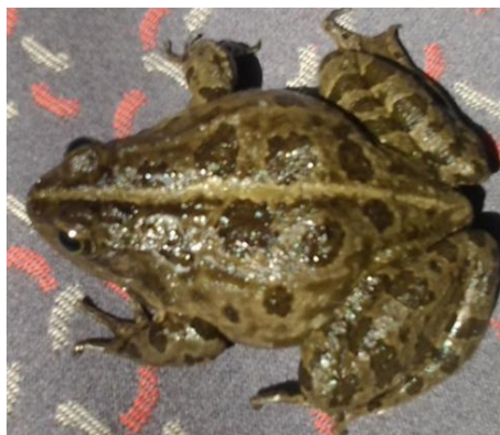
Exemplar d'aquesta població.

verdes: Pelophylax perezi i Pelophylax kl. grafi , que a part del mateix canal, sols poden trobar refugi en alguna esquerra de la paret cimentada o en el balast de la mateixa via.