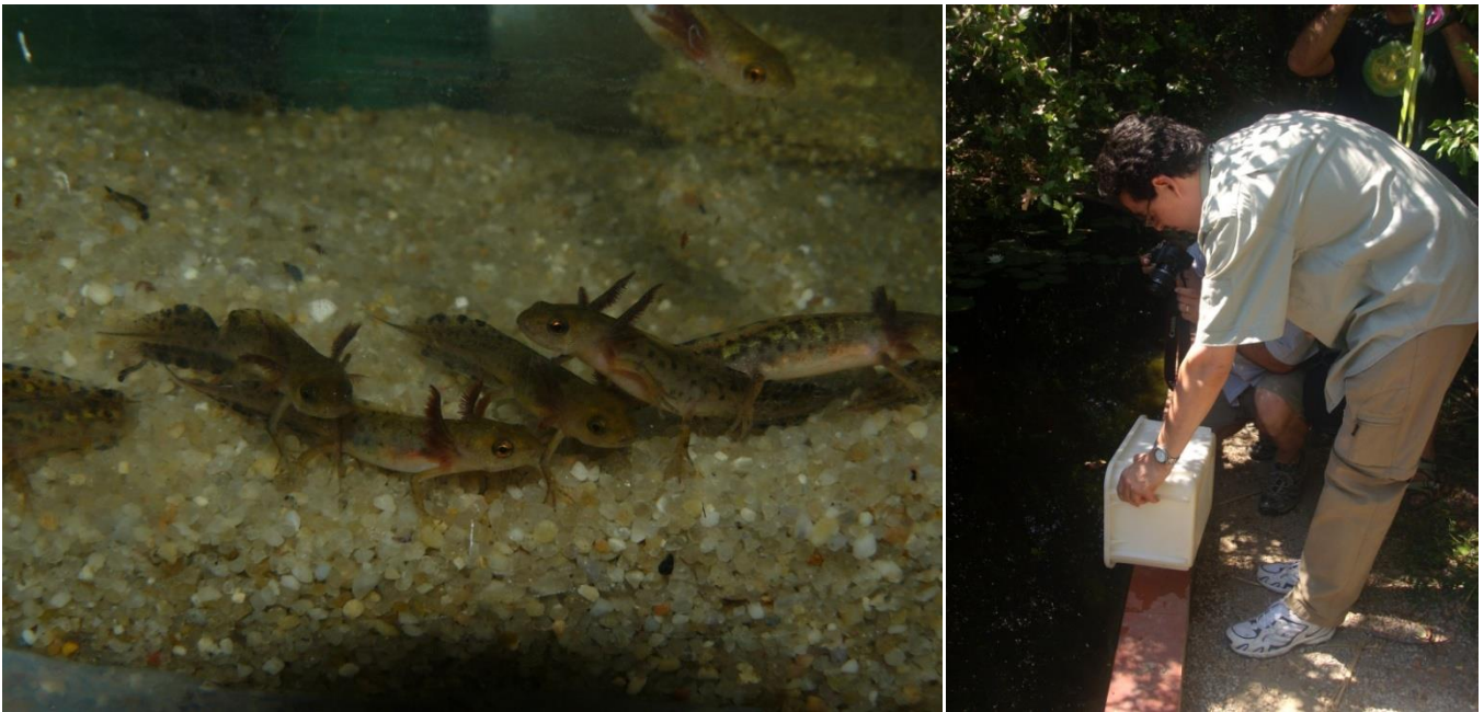
Fotografia de l'esquerra: Larves de tritó verd reproduïdes en captivitat a les instal·lacions de Can Miravitges (Ajuntament de Badalona), per recuperar les poblacions a la serralada Litoral. A la dreta el primer alliberament a la serralada Litoral l'any 2010.

A la SCH també col·laborem amb diferents ajuntaments i altres espais naturals; en concret a la serralada de Marina - Litoral portem a terme un projecte de recuperació de basses per als amfibis, així com el restabliment i millora de poblacions de tritó verd en aquesta serralada.