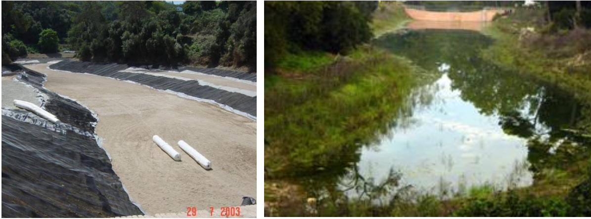
Pantà de Vallvidrera en fase de rehabilitació (esquerra) i un cop recuperat (dreta).

Els projectes de la SCH són ben diversos. En aquest sentit col·laborem amb el Parc Natural de Collserola per recuperar el amfibis i els rèptils d'aquest espai, i actualment duem a terme un projecte de recuperació del gripau d'esperons.