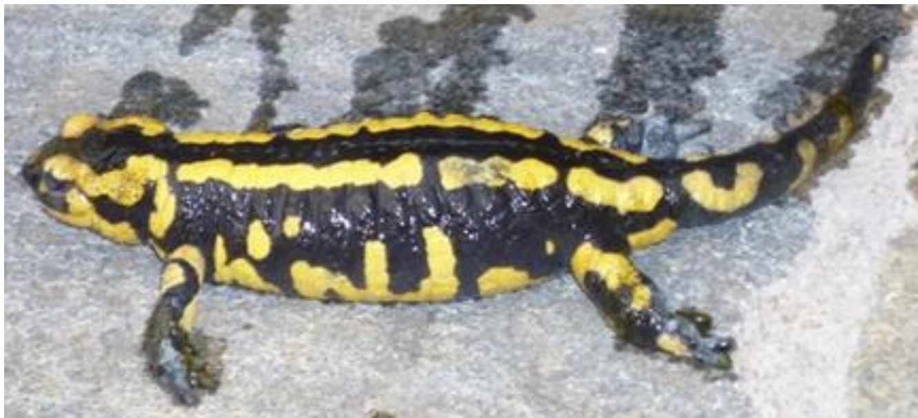
Imatge de l'exemplar trobar mort al safareig de Lleret (Lladorre, Pallars Sobirà).