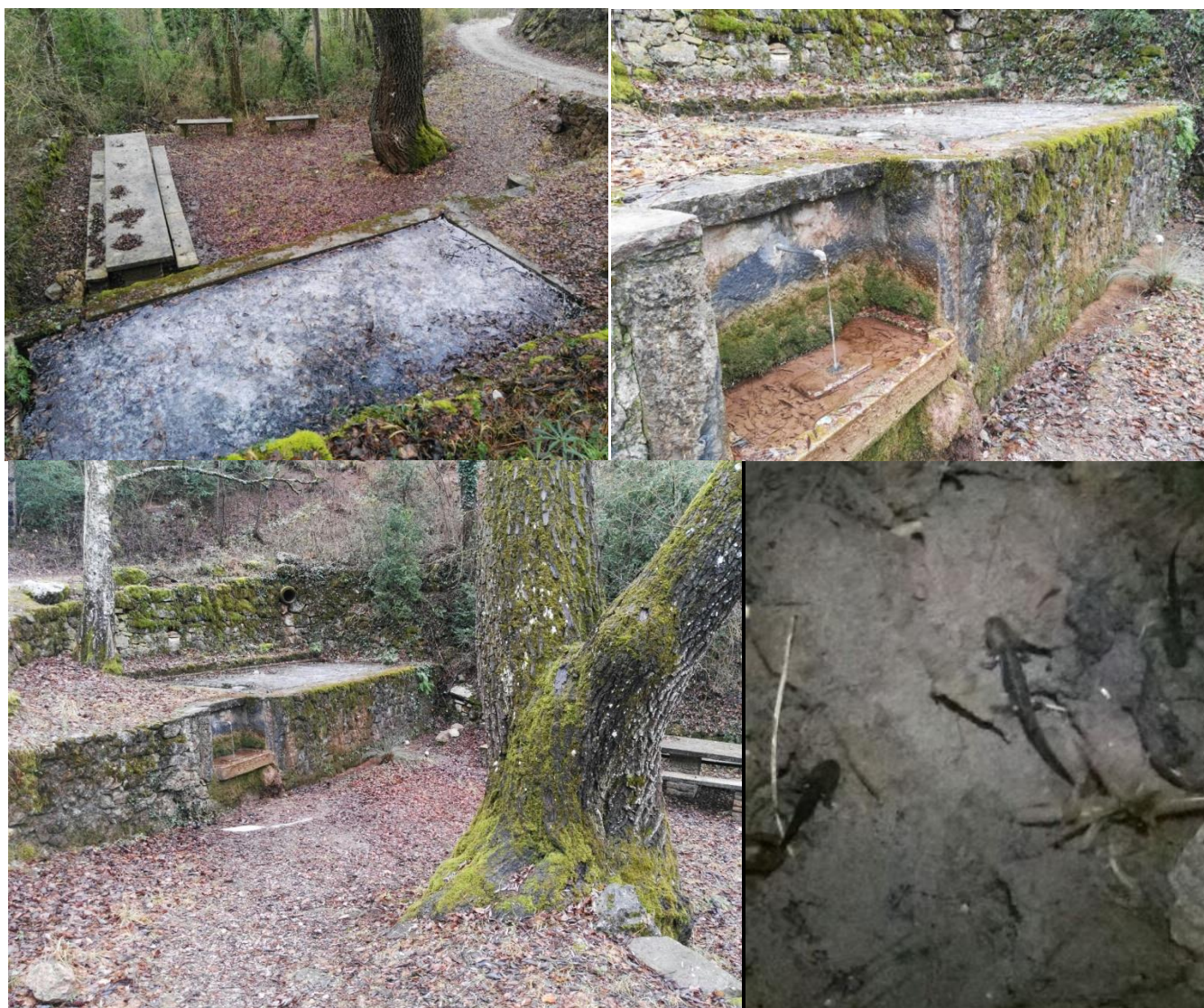
Imatges superiors i inferior esquerra (d'aquesta composició) de la font de Coma Calent (Baix Pallars). Imatge inferior dreta de larves de salamandra prop de Peramea (Baix Pallars).